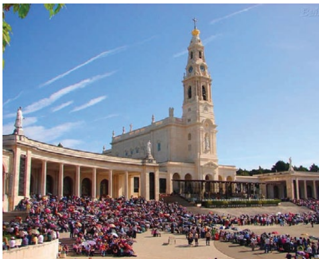
Sanktuarium w Fatimie

Trzecia wizja przeraziła dzieci najbardziej. Anioł, dzierżył płonący miecz i wskazując na Ziemię, trzykrotnie zawołał „Pokuta!”. Później zobaczyły „biskupa odzianego w biel”, który szedł na czele pochodu duchownych wchodzących na stromą górę, na której szczycie znajdował się krzyż. „Ojciec Święty, zanim tam dotarł, przeszedł przez wielkie miasto w połowie zrujnowane i na poły drżący, chwiejnym krokiem, udęczony bólem i cierpieniem, szedł modląc się za dusze martwych ludzi, których ciała napotykał