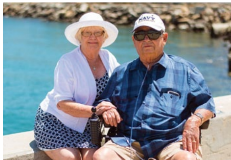
W oparciu o materiały Komunii Małżeństw opracowała U.B