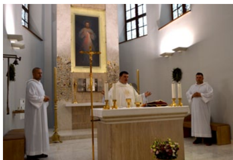
Msza święta kolbudzkiej wspólnoty parafialnej w czerwcu ubiegłego roku w Wilnie

W wileńskiej dzielnicy Antokol (10 minut autobusem od Placu Katedralnego) warto odwiedzić przy ulicy Grybo 29a drewniany Domek św. Faustyny. Pomieszczenia dziś udostępnione